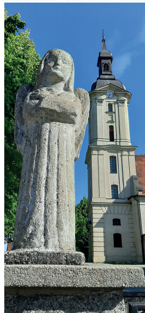
Sanktuarium w Górcie Duchownej

wnętrze. Warto też zajrzeć na cmentarz i pochylić się nad mogiłą pochodzącego z Żakowa Zdzisława Szczawińskiego (1842-74) – to prawdopodobnie jedyny zachowany do dziś w powiecie leszczyńskim nagrobek powstańca styczniowego. W Wyciążkowie na uwagę zasługuje dwór oraz mieszczący się w jego sąsiedztwie plac zabaw, który dowodzi, że pomysłowość nie zna granic. Do Leszna wracamy przez malownicze i systematycznie rozbudowujące się Gronówko. Zdecydowanie zachęcamy, by zarezerwować sobie dzień w kalendarzu na taką wyprawę.